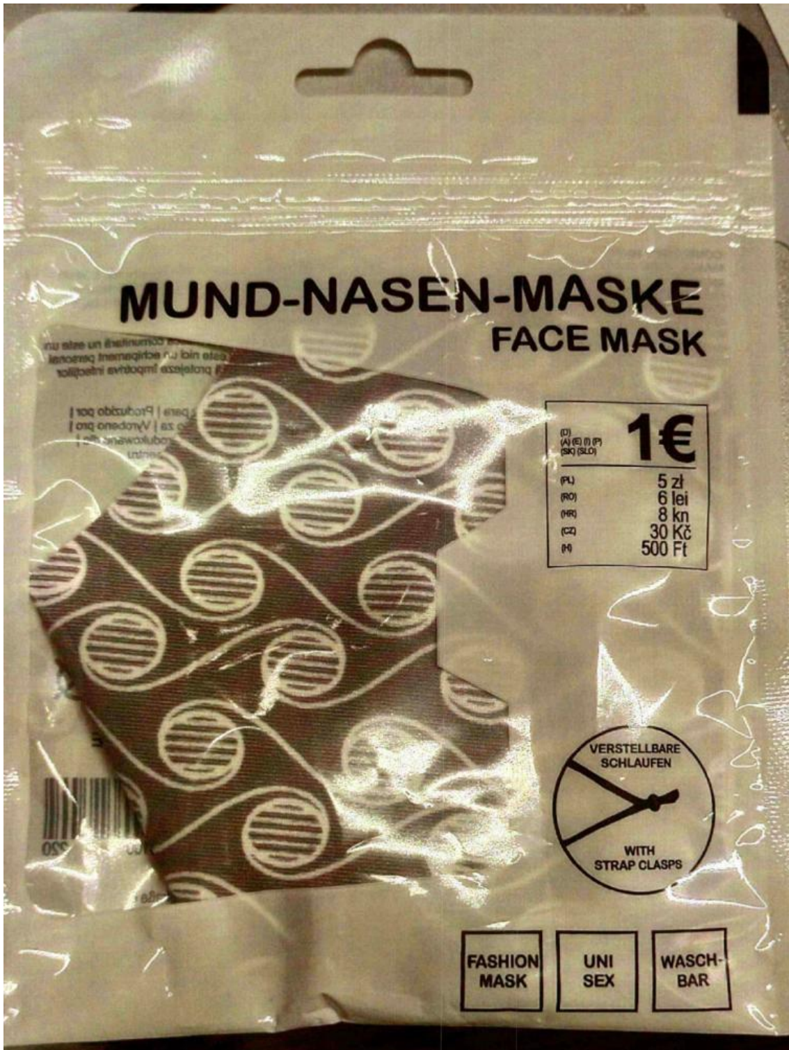
Fotografía del anverso del producto